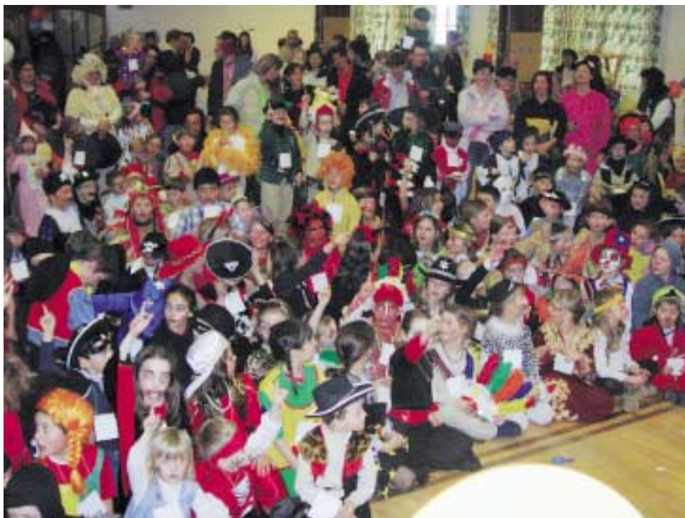
Die Kinder warten gespannt auf den Auftritt des Zauberers

Die Vorfreude der Kinder und der Organisatoren auf den nächsten Fasching ist jetzt schon groß! Lei lei!