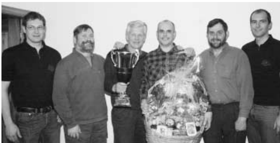
Die Siegergruppe „Jagd Barwies“

Trotzdem waren sowohl bei den Qualifikationsdurchgängen als auch im Finaldurchgang die Leistungen sehr gut. Her-