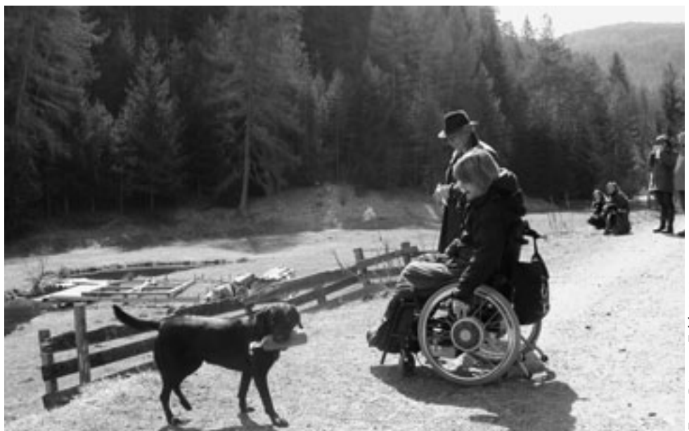
Ein Labrador-Retriever bringt den auf den Boden gefallenen Dummy wieder zurück.