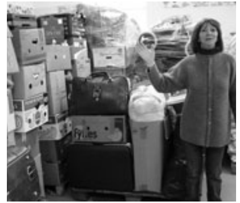
Mehr als zwölf Tonnen waren binnen weniger Wochen gesammelt