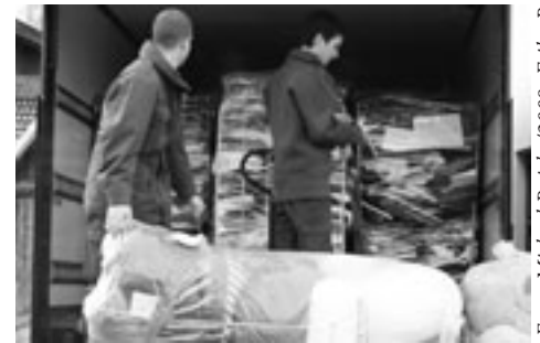
Das Österreichische Bundesheer liefert die Hilfsgüter nach Suva Reka / Kosovo.