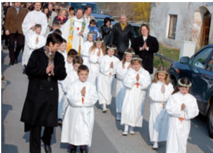
Die Kinder der Pfarre Untermieming