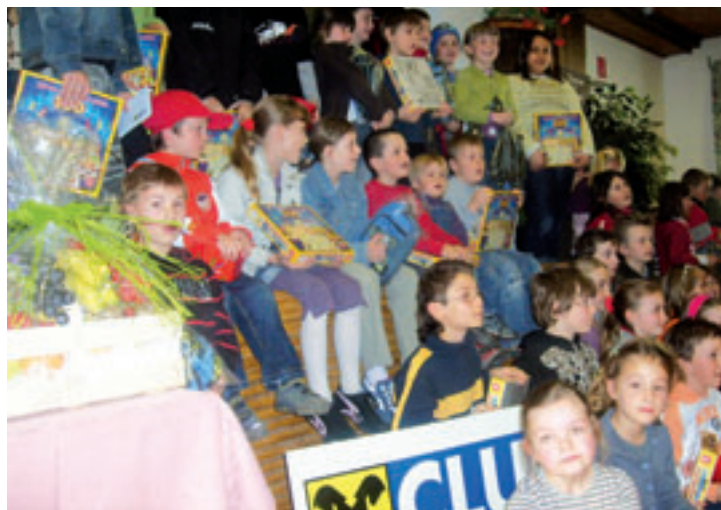
So viele glückliche GewinnerInnen – die Preisträger der Volksschulen haben gar nicht alle auf dem Erinnerungsfoto Platz