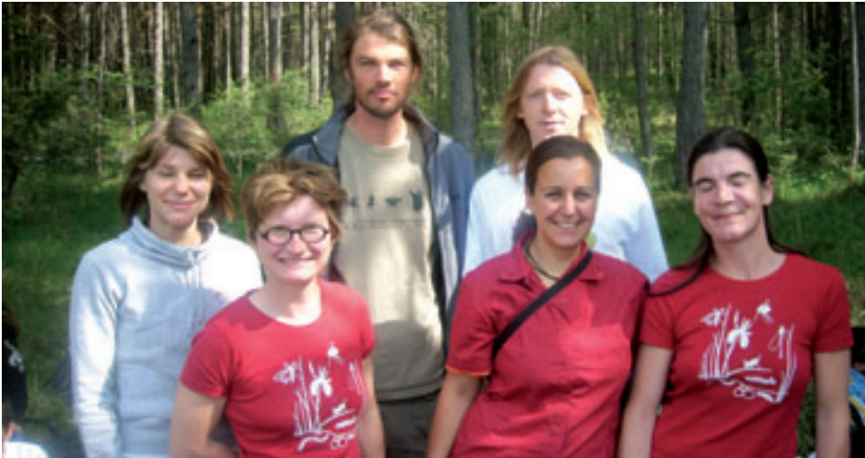
Herzlichen Dank dem Team von „Natopia“ für einen unvergesslichen Schultag