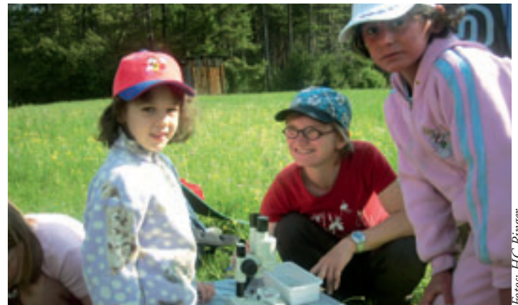
Das Mikroskop ermöglicht tolle Einblicke in eine fabelhafte Wunderwelt