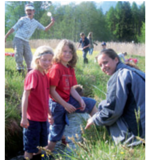
Gut, dass wir alle Stiefel tragen

(hc) Jeder Mensch erkennt nur was er kennt. Es ist nicht möglich, irgendetwas Wert zu schätzen und zu achten, von dem man gar nicht weiß, dass es überhaupt existiert. Die Artenvielfalt der Tier- und Pflanzenwelt unserer Heimat ist faszinierend, eine Welt voller Wunder, die zum Staunen und Entdecken einlädt. Zahlreiche Pflanzen und Tiere bilden sensible Lebensgemeinschaften, deren Schutz und Erhaltung uns Verpflichtung sein sollte. Die 105 Kinder der Volksschule Barwies konnten am Donnerstag, den 15. Mai bei traumhafter Witterung einen Vormittag lang angeleitet von einem Biologenteam und ihren LehrerInnen die fantastische Fauna und Flora bei fünf interessanten Stationen erforschen. Vorhandene Kenntnisse über das Leben im Moor, im Schilf, am Bach, im Wald und auf der Wiese wurden vertieft und durch spektakuläre Entdeckungen erweitert. Naturfilme und Dokumentationen im Fernsehen mögen ja recht toll, unterhaltsam und spannend sein – aber was ist das schon im Vergleich zu den eigenen Entdeckungen, die quasi vor unserer Haustüre möglich sind.