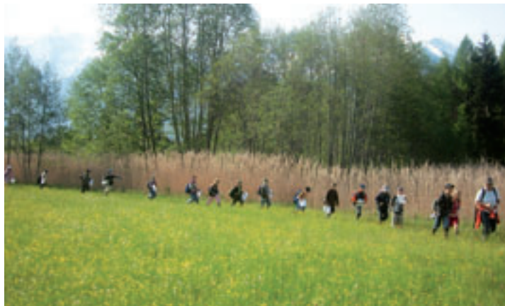
Jeder Schritt wird mit Bedacht gesetzt