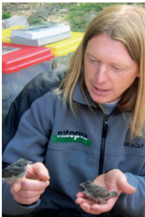
Insekten, die wir Menschen als Schädlinge bezeichnen, finden unsere gefiederten Freunde recht nützlich – vor allem nahrhaft und lecker!

(hc) Jeder Mensch erkennt nur was er kennt. Es ist nicht möglich, irgendetwas Wert zu schätzen und zu achten, von dem man gar nicht weiß, dass es überhaupt existiert. Die Artenvielfalt der Tier- und Pflanzenwelt unserer Heimat ist faszinierend, eine Welt voller Wunder, die zum Staunen und Entdecken einlädt. Zahlreiche Pflanzen und Tiere bilden sensible Lebensgemeinschaften, deren Schutz und Erhaltung uns Verpflichtung sein sollte. Die 105 Kinder der Volksschule Barwies konnten am Donnerstag, den 15. Mai bei traumhafter Witterung einen Vormittag lang angeleitet von einem Biologenteam und ihren LehrerInnen die fantastische Fauna und Flora bei fünf interessanten Stationen erforschen. Vorhandene Kenntnisse über das Leben im Moor, im Schilf, am Bach, im Wald und auf der Wiese wurden vertieft und durch spektakuläre Entdeckungen erweitert. Naturfilme und Dokumentationen im Fernsehen mögen ja recht toll, unterhaltsam und spannend sein – aber was ist das schon im Vergleich zu den eigenen Entdeckungen, die quasi vor unserer Haustüre möglich sind.