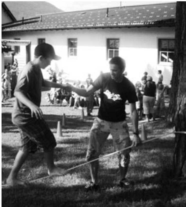
Olympiasieger Andreas Widhölzl unterstützt die Kinder beim Balancieren auf der Slackline

ches Dankeschön jenen engagierten Müttern und Vätern, die sich mit viel Fantasie und großartigem Einsatz in die Organisation und Durchführung dieser beliebten Veranstaltung eingebracht haben.