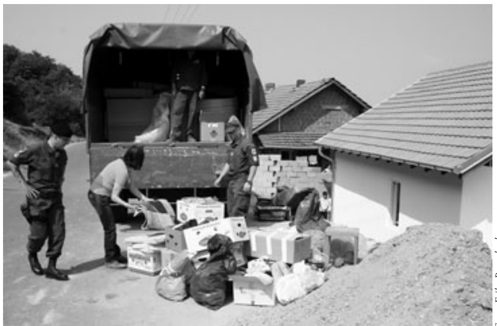
Die Mieminger Hilfstransporte kommen direkt zu den Bedürftigen im Kosovo