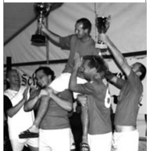
HPS gewinnt den Wanderpokal