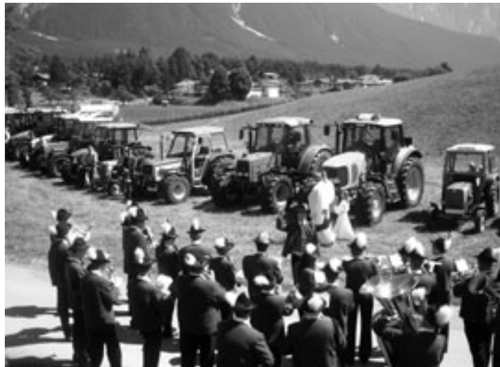
Die Musikkapelle Mieming umrahmt die feierliche Segnung der Landmaschinen und die für unsere Gemeinschaft unentbehrlichen Arbeit, die damit verrichtet wird