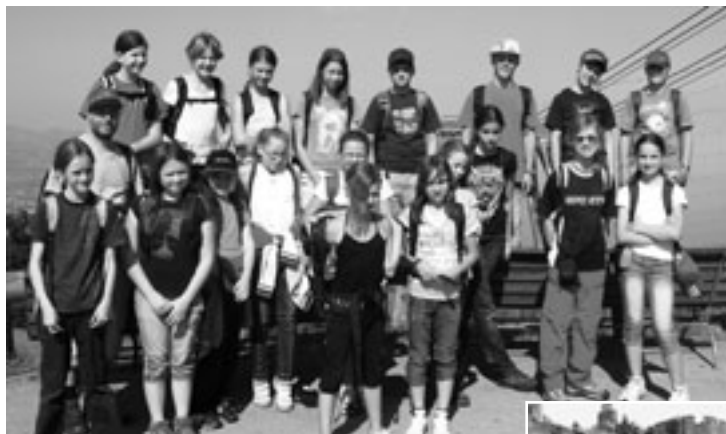
Auf dem Pfänder