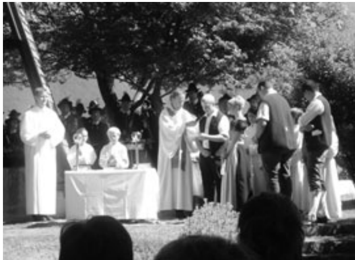
In ihren Fürbitten brachten die VertreterInnen der Landjugend ihre Anliegen und ihre Dankbarkeit zum Ausdruck

tesdienstes und der darauf folgenden Segnung der Landmaschinen und ihrer Besitzer sorgte die Musikkapelle Mieming. Im Anschluss daran luden Jungbauern und Landjugend, auf bewährte Weise unterstützt von den Mieminger Bäuerinnen, zum gemütlichen Frühschoppen mit dem Joggel Trio in die Agrarmaschinenhalle.