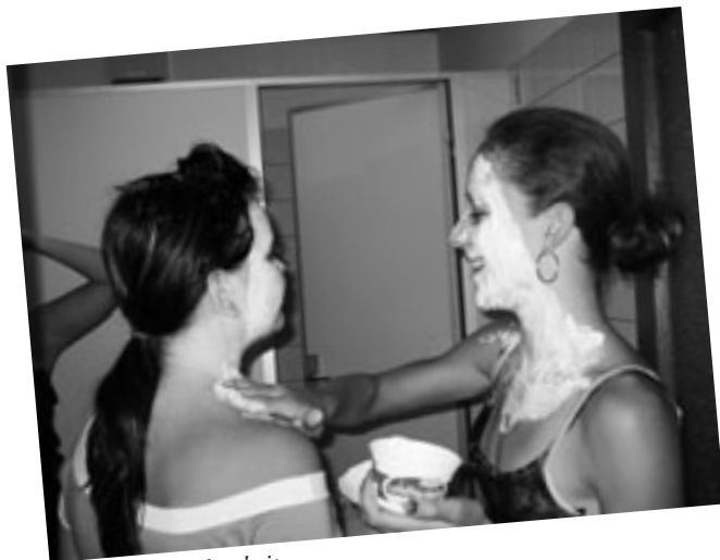
Alles für die Schönheit