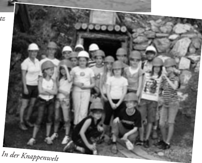
In der Knappenwelt