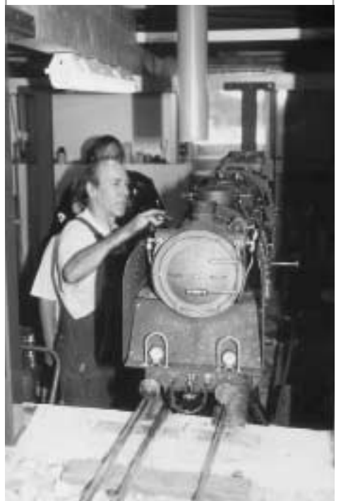
Gartenbahnanlage Barwies: die größte Modelleisenbahn Westösterreichs

Mit einem umfang- und abwechslungsreichen Festprogramm wird die Anlage eröffnet, beginnen die Publikumsfahrten, wird die Gemeinde Mieming um eine einzigartige Attraktion reicher sein!