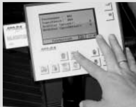
Der Computer im Müllwagen

Entsprechend dem Gemeinderatsbeschluss vom 6.6.2002 können übrige, in den Jahren 1999/2000/2001 zusätzlich gekaufte Schleifen zurückgegeben werden und müssen mit den entsprechenden Quittungen nachgewiesen werden.