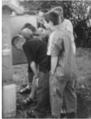
Schüler durften das Bienenvolk miterleben